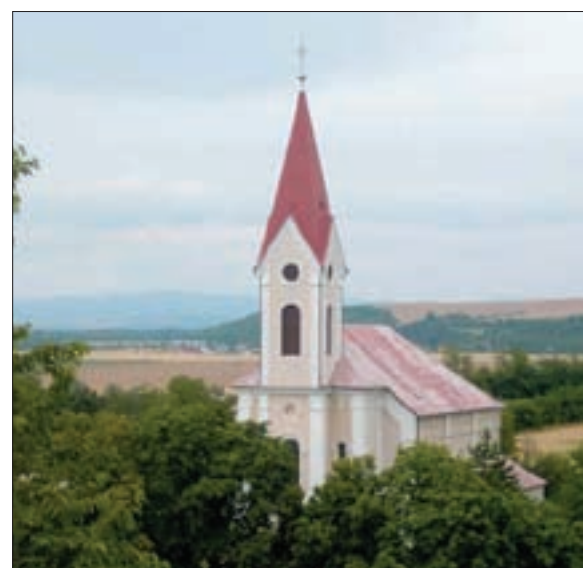
▲ Nový kostol. New Church. Neue Kirche.

At the western foothills of the mountain range Považský Inovec, a loess gorge Great Trench, nearly 20 m deep and several hundred meters long with area of 0.85 hectare, spreads out. It was created naturally by gully erosion in less than 100 years. It was declared