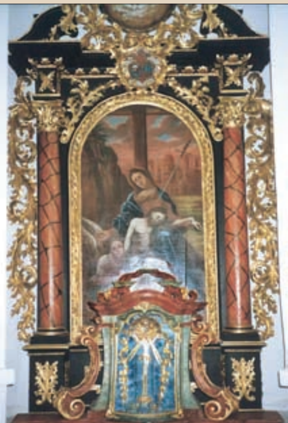
▲ Pohľad na interiér kaplnky v kaštieli - oltár. Altar in the castle chapel. Anblick des Interieurs der Kapelle im Kastell - Altar.