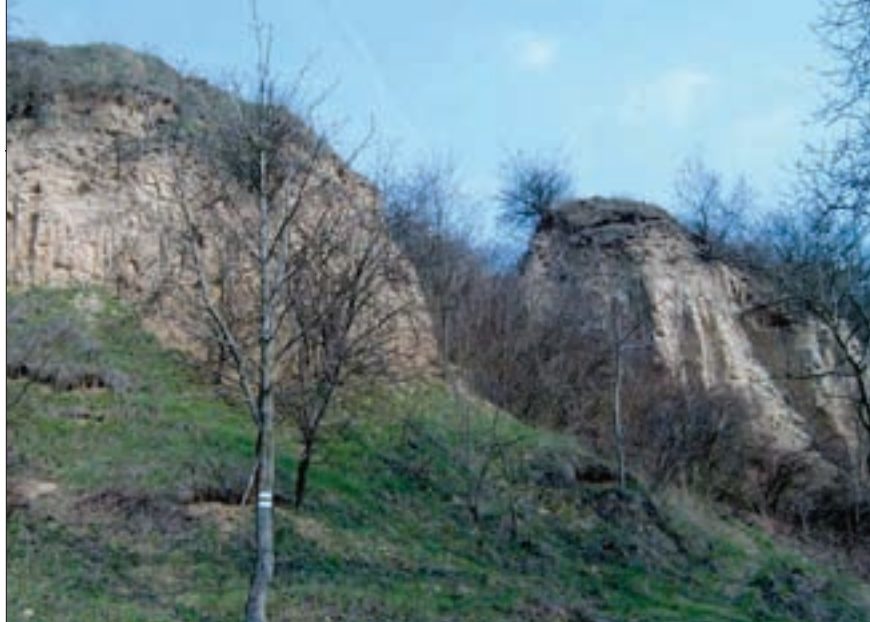
▲ Chránený prírodný útvar Veľký jarok. Protected creation of nature Veľký jarok (Great Trench). Naturschutzdenkmal Veľký jarok.

Part of Piešťany Spa is located on Moravany land. Large part of the village is in protected Spa area and that is why great attention is paid to environmental issues. Several natural, geological, mineralogical, paleolithic, archeological, sacral and cultural objects can be found here. One of them is a Renaissance castle from 16th century. In 18th century, castle was rebuilt in Baroque style and a chapel was constructed in place of the east bastion. The castle was and still is a place where various gatherings and conferences take place, like those for painters, graphic artists, sculptors, musicians.... The nearby park is state protected object and you can find there very specific flora. There was a narrow-gauge railway (app. 12 km long) heading from the castle to the nearby forrests. Carriages with lumber were sent down in a free fall. We can learn about this unique technological relic along the Moravany forrest educational footpath. It starts just behind the Striebornica water reservoir. Several water mills were on Striebornica creek. There is a garden and forrest cabin area nearby. Small cave is hidden in the forrest, direction recreational area Výtoky.