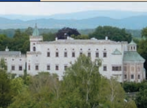
▲ Moravianský kaštieľ. Moravian Castle. Moravians Castell.