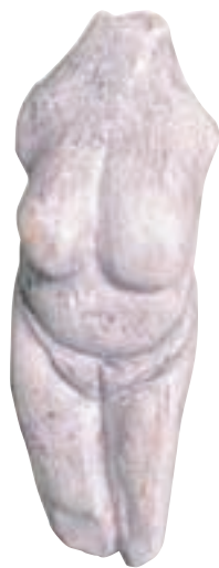
▲ Moravianska venuša Venus from Moravany Venus von Moravany

Moravany nad Váhom figures in European archeological maps thanks to remarkable Stone Age sites. The village is mostly known for a small, 7.6 cm tall statuette known as „Venus from Moravany“. It is the oldest proof of artistic craftsmanship in Slovakia. It was carved out from a mammoth tusk some 22 800 years ago. According to experts, three „Venuses“ were found in Moravany. One was ploughed out from a field by a farmer and he gave it to a German manufacturer whose