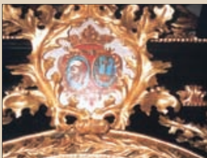
▲ Erb rodu Čáki - Ziči. Coat of arms - Csaky clan, Zichy clan. Wappen des Geschlechtes Csáky - Zichy.

the gorge walls offer rich paleontologic finds in form of mollusc fossils and firestone industry (blades, spears, chisels and spades).