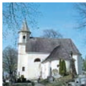
▲ Kostol sv. Martina z Tours. St. Martin from Tours Church. Kirche des hl. Martin aus Tours.

The oldest monument in village is the St. Martin from Tours church. It lies in cemetery above the village, along with chapel consecrated to Our Lady of Sorrows, patron saint to Slovakia. It was built in 15th century on Roman church foundations from the first half of 13th century. It has roof with wooden shingles and fired bricks floor. A sextagonal tower was added to the west side of church in 16th century. In the following century, further adjustments with Baroque elements were made. Baroque chapel was built on south side of church in the second half of 18th century. According to a legend, the church served as mosque during Turkish raids in Slovakia.